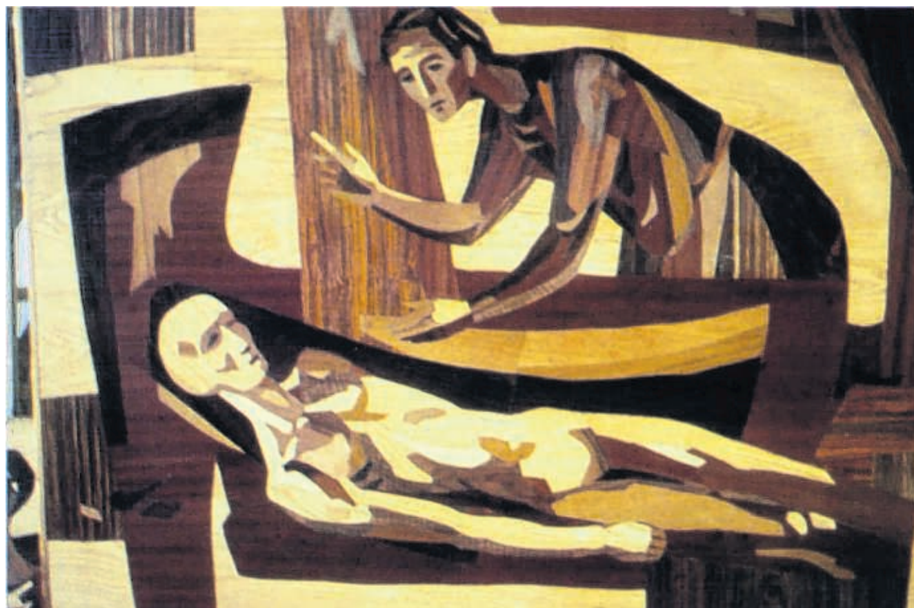
Opwekking van Lazarus. Kunstwerk bij de begraafplaats Sint Barbara in Utrecht.

5 Paneel over vrede en welvaart in raadszaal voormalige gemeente Oosterland (die Soest adopteerde na de watersnoodramp), 1953.